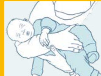
مسك الطفل الرضيع

يكون لدى الأطفال الرضع رأساً ثقيلًا بالتناسب مع جسدهم، الذي لا يمكنهم أن يمسكوه بأنفسهم. فعضلات عنقهم لم تتكون بعد من أجل ذلك. ولذلك ادعموا رأس الطفل الرضيع دائماً.