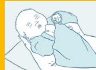
رفع الطفل الرضيع