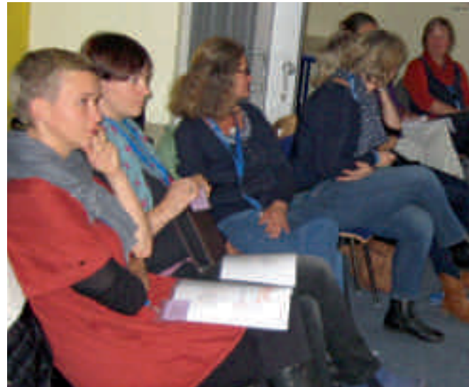
Fachtag Familienhebammen Güstrow

Um einen effektiven und niedrigschwelligen Zugang zu den Familien zu erreichen, hat sich in vielen Landkreisen eine Untergliederung der kommunalen